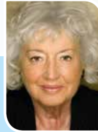
Renate Schmidt Bundesfamilienministerin a. D.

Die ASV setzt die Vision einer zeitgemäßen Früherkennung und Versorgung der Patienten interdisziplinär, multimodal und sektorenübergreifend durch Vernetzung und strukturierten Datenaustausch endlich in der Praxis um.